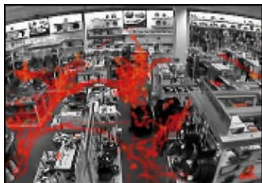
Bild eines Netzwerk-Videosystems zur Aufzeichnung und Anzeige von Kundenaufkommen in Gängen. Die roten Linien stellen Kunden dar.