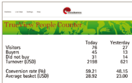
Eine netzwerkbasierte Personenzählung ermöglicht die Einbeziehung von Kassendaten zur Analyse des Kundenverhaltens.