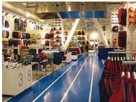
Daten aus der Personenzählung liefern wichtige Informationen bei der Ladengestaltung.